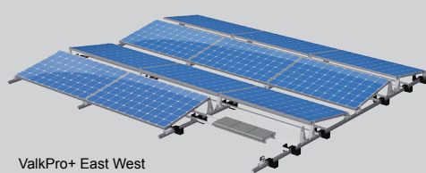
ValkPro+ East West